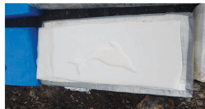
Mostrario de imágenes con los delfines identificados en los paquetes de clorhidrato de cocaína.