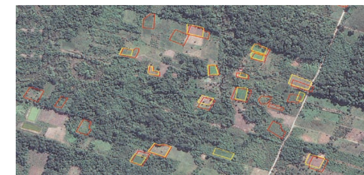
Captura de imágenes satelitales: A la izquierda, en la población Siguaní Grande, municipio de La Asunta, en la región de los Yungas de La Paz y, a la derecha, en la población Los Ángeles, municipio de Puerto Villarroel, en el Trópico de Cochabamba. Los polígonos en color rojo representan los cultivos de coca de 2017 y los polígonos amarillos, los cultivos de coca de 2018.