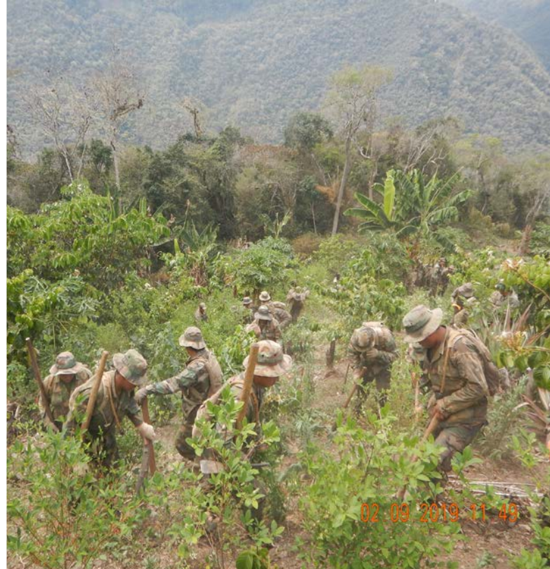
Grupos de trabajo durante las tareas de erradicación en el municipio de Villa Tunari, en el Trópico de Cochabamba (a la izquierda) y en el municipio de Inquisivi, en la región de Sud Yungas de La Paz (a la derecha).