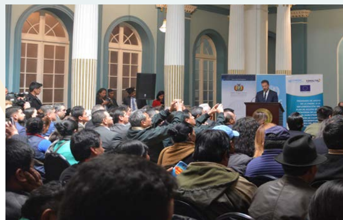
El Representante de la UNODC, Thierry Rostan, en la presentación del Informe de Monitoreo de Cultivos de Coca 2018, en la Cancillería.

Las recomendaciones principales son las siguientes: 1) Concluir con la delimitación geográfica de Zonas Autorizadas para la producción de hoja de coca, según lo mencionado en la Ley General de la Coca (Ley 906) y su Reglamento, para evitar la expansión del cultivo de coca; 2) Incrementar las medidas de control de estos cultivos para evitar su expansión a Zonas No Autorizadas y 3) Continuar fortaleciendo los procesos de racionalización/erradicación, control social y la mitigación de impactos, promoviendo el desarrollo integral en las zonas productoras de coca, para evitar la expansión de la producción excedentaria de cultivos de coca.