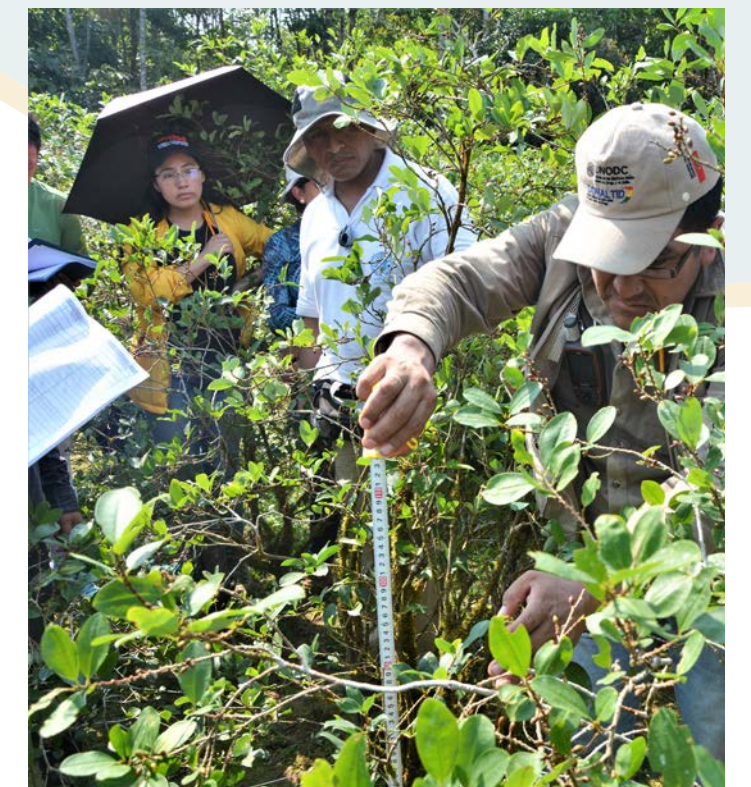
Personal de la UNODC demuestra a los encuestadores la forma de medir la altura de la planta de coca.

rendimiento en la región de Los Yungas de La Paz, ya que en la región del Trópico de Cochabamba el pasado mes de mayo fueron realizadas las mismas pruebas en las comunidades de Valle Central y Nor Chichas pertenecientes a los Municipios de Puerto Villarroel y Carrasco respectivamente.