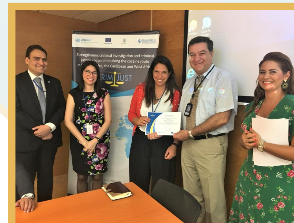
Integrantes del grupo multiagencial reunidos en Viena en julio de 2019.

En diciembre de 2019, se planteó la celebración reuniones de trabajo y revisión del contenido de los documentos, que se realizarán en enero de 2020 con participación de las instituciones involucradas.