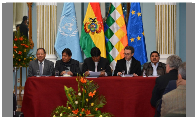
Presentación Informe de Monitoreo de Cultivos de Coca 2013

La temporal ausencia de Bolivia de la Convención (principalmente 2011 y 2012) dificultó el acceso a financiamiento para COBOL, ya que muchos donantes estaban reacios a apoyar financieramente a Bolivia durante este periodo. El reingreso de Bolivia a la convención marcó un nuevo capítulo en el trabajo de la UNODC con la llegada del nuevo representante, quien supo crear acertadamente alianzas de confianza con el Gobierno, donantes y la comunidad internacional.