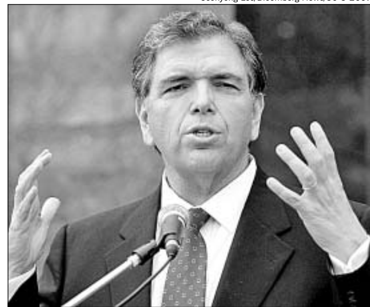
CHARLES PRINCE, do Citigroup: "Sei que podemos fazer muito melhor"

Segundo a consultoria Thomson Financial, os lucros do setor bancário devem registrar alta de apenas 3% no terceiro trimestre, muito abaixo do crescimento de 34% obtido no mesmo período do ano passado.