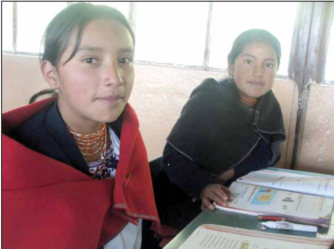
Centro Educativo Comunitario Intercultural Bilingüe Mushuk Ñan