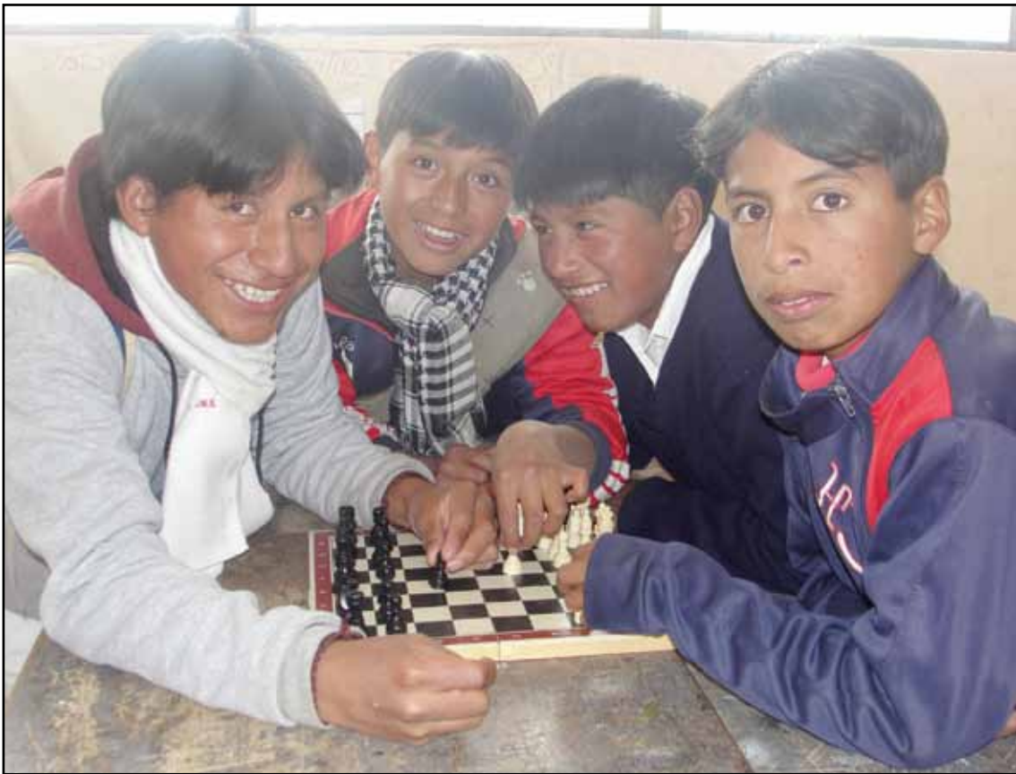
Centro Educativo Comunitario Intercultural Bilingüe Mushuk Ñan