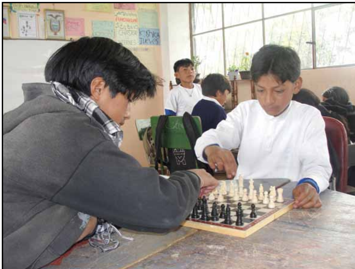
Centro Educativo Comunitario Intercultural Bilingüe Mushuk Ñan