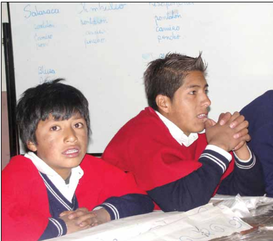
Unidad Educativa Intercultural Bilingüe Ambayata