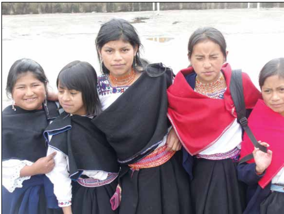
Centro Educativo Comunitario Intercultural Bilingüe Mushuk Ñan