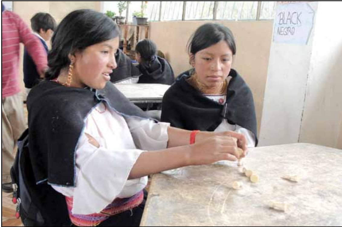
Centro Educativo Comunitario Intercultural Bilingüe Mushuk Ñan