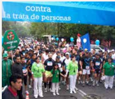
Забег против торговли людьми в Мексике.