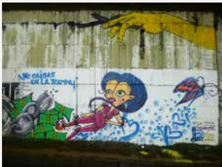
Граффити, сделанное колумбийскими студентами в рамках программы УНП ООН по привлечению внимания общественности к проблеме торговли людьми.