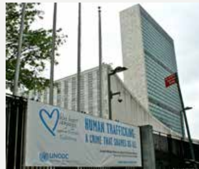
Баннер кампании «Голубое сердце» перед штаб-квартирой ООН в Нью-Йорке.

организации, и всех тех, кому не все равно, присоединится к кампании. Сделать это можно следующими способами: