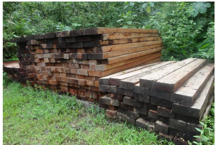
Acopio de madera aserrada de PGMF