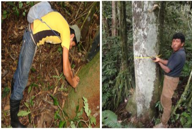
Censo forestal en la comunidad 1º de julio Municipio La Asunta