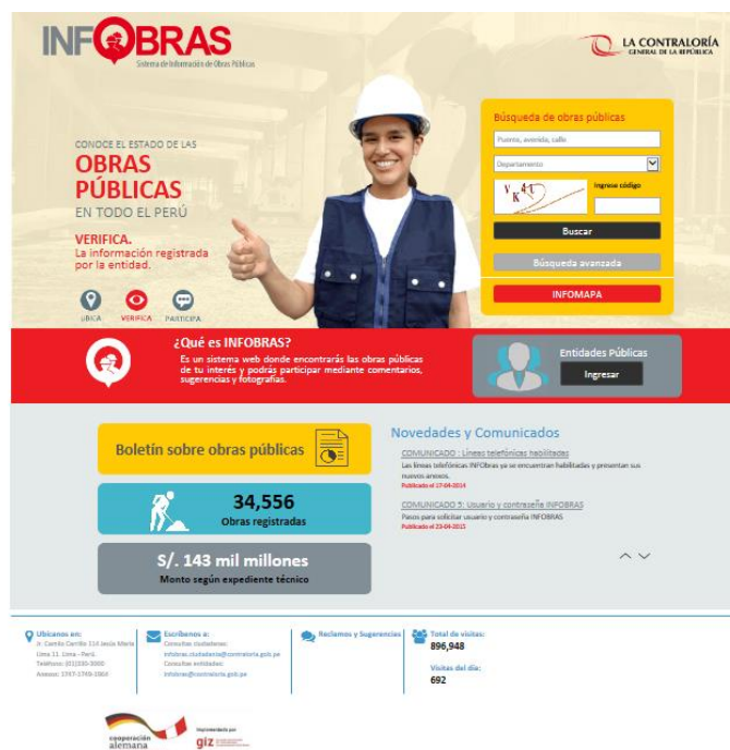
Ilustración 3. Aplicativo INFOBRAS ( www.contraloria.gob.pe )