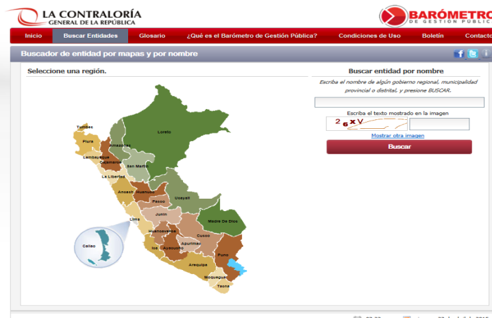
Ilustración 1. Barómetro de Gestión Pública ( www.contraloria.gob.pe )