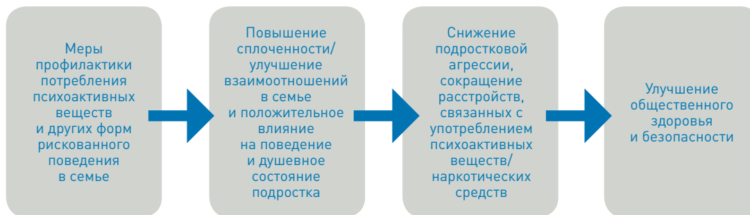
Рис. 4. Теория изменений для программы Treatnet Family

Методика Treatnet Family построена вокруг нескольких ключевых элементов научно обоснованных методов семейной психотерапии (Hogue et al, 2009) и сочетает в себе такие терапевтические приемы, как позитивное переосмысление норм поведения, намерений и взаимодействия; реляционное мышление, переосмысление ситуации и вмешательство; видение ситуации с точки зрения других людей; вовлечение в процесс различных систем; смягчение противодействия и отрицания; определение и использование сильных сторон семьи; ободрение; усиление родительского взаимодействия и поддержки; проведение системных оценок и принятие мер исходя из текущей ситуации. Эти элементы были изначально разработаны в странах с высоким уровнем дохода, и задача программы Treatnet Family состоит в том, чтобы сделать их доступными в странах с низким и средним уровнем дохода для работы с подростками, страдающими расстройствами на почве употребления алкоголя и наркотиков, и их семьями. В методике Treatnet Family объединены отдельные элементы научно обоснованных методов семейной психотерапии, подходящие для решения проблем, связанных как с потреблением психоактивных веществ, так и с делинквентным поведением подростков.