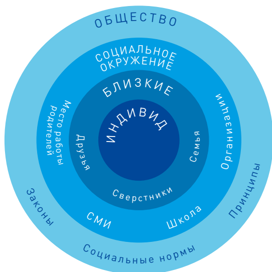
Рис. 1. Теория социальной экологии Бронфенбреннера

Согласно теории социальной экологии Бронфенбреннера (Bronfenbrenner, 1979), индивиды рассматриваются как часть комплекса взаимосвязанных систем, охватывающих индивидуальные, семейные и внесемейные (сверстники, школа, соседи) факторы. Поведение рассматривается как продукт взаимодействия индивида и этих систем и отношений систем друг с другом.