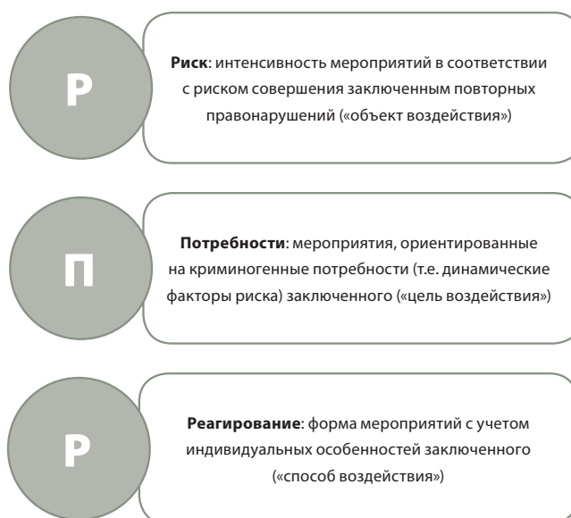
Рис. III. Система реагирования на риски и потребности

На рис. IV представлены общие факторы, касающиеся рецидивизма и связанных с ним криминогенных потребностей. Исправительное воздействие, направленное на оказание правонарушителям помощи в устранении этих потребностей, может осуществляться в соответствующем учреждении или в общине. Разумеется, проблема по-прежнему состоит в том, что абстрактную модель, лежащую в основе данной системы, трудно воплотить в конкретные мероприятия, адаптированные для разных групп правонарушителей.