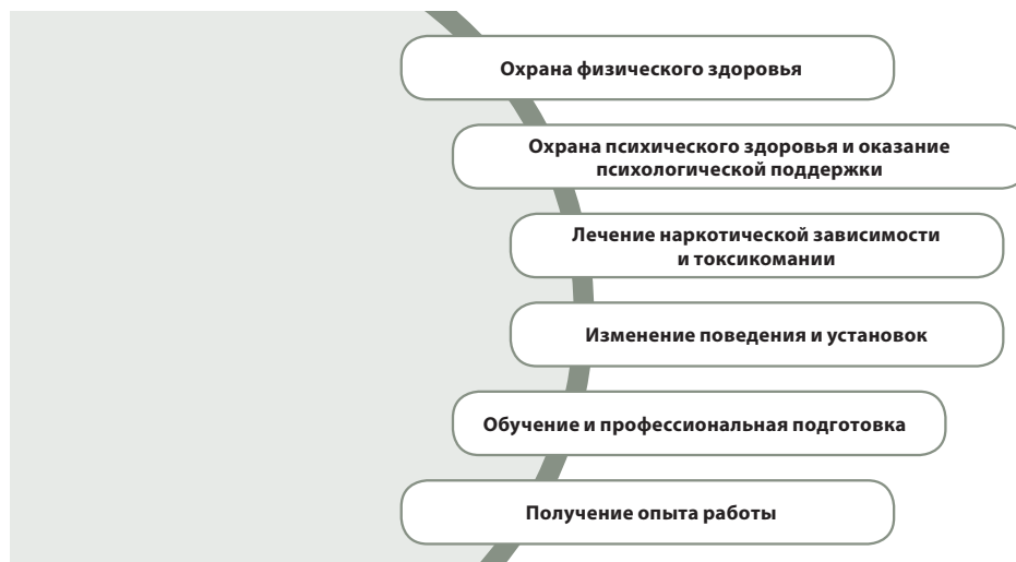
Рис. V. Виды программ, осуществляемых в условиях пенитенциарных учреждений

На практике тюремная администрация редко обладает ресурсами и средствами, позволяющими обеспечить весь перечень вышеупомянутых программ для всех заключенных, которые в них нуждаются, в тот момент, когда у заключенных существует потребность в этих программах. Заключенным, как правило, приходится ждать, иногда в течение нескольких лет, прежде чем они смогут получить доступ к той или иной программе.