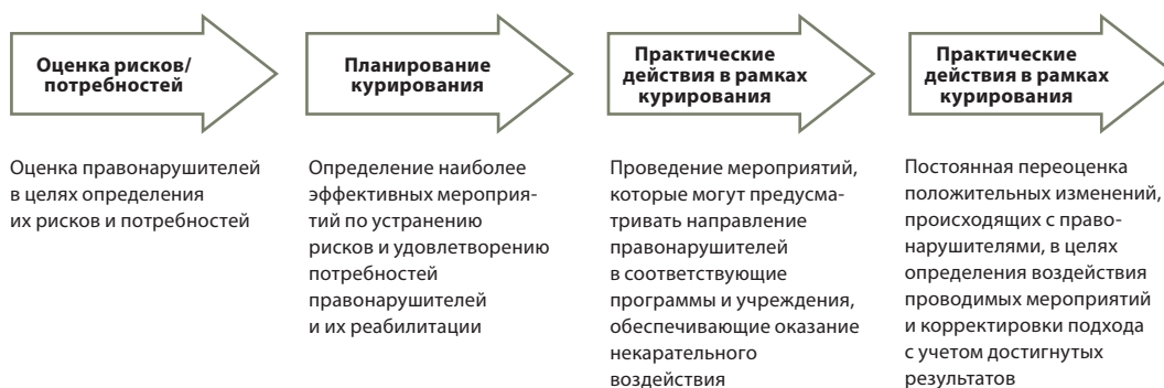
Рис. VI. Модель курирования