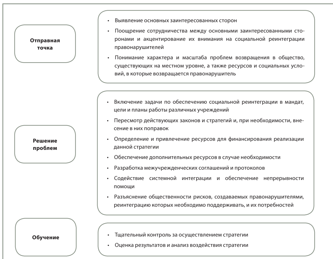
Рис. II. Элементы стратегии социальной реинтеграции правонарушителей

Простого рецепта для разработки эффективной и всеобъемлющей стратегии предупреждения рецидивизма и социальной реинтеграции правонарушителей не существует. Применяемый в каждой стране подход в значительной степени определяется действующими законами и ресурсами, имеющимися у системы правосудия и конкретной общины, а также готовностью населения к последовательной реализации инициатив по предупреждению рецидивизма. Тем не менее некоторые из основных шагов по планированию и осуществлению стратегии социальной реинтеграции правонарушителей являются довольно схожими (см. рис. II).