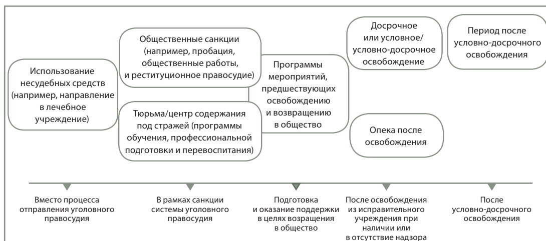
Рис. I. Программы социальной реинтеграции и процесс отправления уголовного правосудия

Все мероприятия такого рода лучше всего осуществлять в рамках единой программы, направленной на решение конкретных вопросов и проблем конкретного правонарушителя. Вероятность положительных результатов реинтеграции выше в случае устранения факторов,