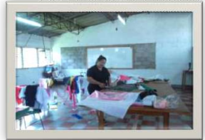
TALLER DE MANUALIDADES