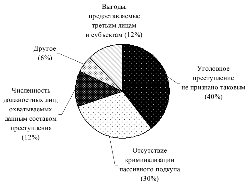
Диаграмма IV Трудности, касающиеся статьи 16 (Подкуп иностранных публичных должностных лиц и должностных лиц публичных международных организаций)