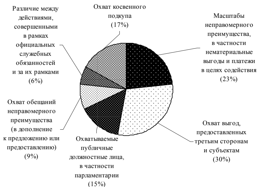
Диаграмма III Трудности, касающиеся статьи 15 (Подкуп национальных публичных должностных лиц)

9. Ряд государств-участников не приняли конкретных мер для криминализации активного и пассивного подкупа иностранных публичных должностных лиц и должностных лиц публичных международных организаций. Так, соответствующие деяния не являются уголовно наказуемыми в 14 случаях, хотя в семи случаях готовятся соответствующие законопроекты, а в шести других случаях уголовно наказуемым считается лишь активный подкуп. Тем не менее в одном из этих государств иностранные должностные лица привлекались к ответственности по обвинению в отмывании денежных средств, полученных в результате коррупции, признаваемом в качестве основного правонарушения согласно соответствующему законодательству. Общие трудности в данной области были связаны с неразвитостью нормативной базы и ограниченностью потенциала. В случае необходимости государствам было рекомендовано принять конкретные меры для прямого охвата иностранных публичных должностных лиц и должностных лиц публичных международных организаций. В двух случаях нормы о подкупе иностранных должностных лиц предусматривали исключение в отношении платежей в целях содействия, имеющих целью ускорить или гарантировать выполнение обычных административных действий иностранными должностными лицами, политическими партиями или партийными функционерами, в связи с чем этим государствам были даны соответствующие рекомендации. Были выявлены также пробелы в том, что